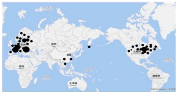
图2 医学伦理学研究机构的空间分布

知识图谱教学方法的课后反馈。通过采用知识图谱教学方法,生动形象地展示出了医学哲学(伦理学)的研究前沿及演化路径,使得讲课时有根有据,充满底