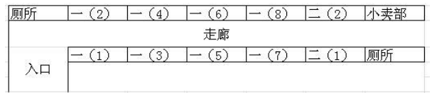
图1 深圳市光明新区某学校小学部教学楼一层分布图

2.3.3 空间分布 本次疫情共波及该校小学部6个年级中17个班级,按年级统计(见表1),各年级罹患率分布差异有统计学意义( \chi^2=70.48, P<0.001 ),罹患率最高的年级是一年级,罹患率达到12.35%,占全部病例的77.61%,其余年级的罹患率均不超过2%。按班级统计(见表2),41个班级中的17个班级发现了水痘病例。病例分布有明显的班级聚集性,罹患率超过10%的班级分别为一年级(3)班、一年级(8)班、一年级(4)班、一年级(6)班、一年级(7)班。该校有两栋独立教学楼,分初中部和小学部,初中部无病例。小学部教学楼共四层,一年级1~8班和二年级1~2班位于一层。罹患率超过10%的班级共5个,全部位于小学部的一层(见图1)。