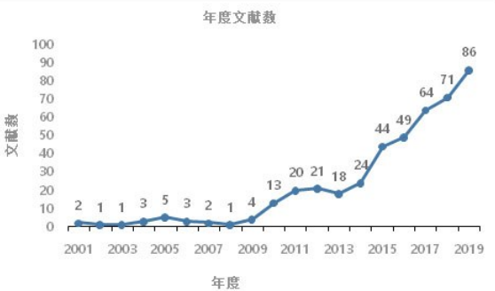
图 1 年度发文图

2.1.1 年度发文趋势 从 2001 年 1 月—2019 年 12 月共检索 432 篇文献,年均发文 22.7 篇,发文量呈逐渐增加趋势,2019 年达最高峰,发表论文 86 篇。大致分三个阶段:早期探索(2001~2009 年),缓慢发展(2010~2014 年),快速发展(2015~2019 年),三个阶段年均发表论文篇数分别为 2.4 篇、19.2 篇、62.8 篇,见图 1。