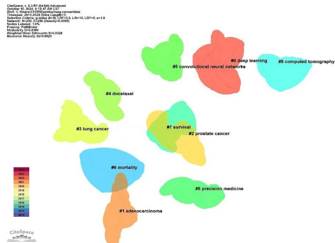
图 5 关键词聚类图谱

2.5.2 关键词聚类分析 关键词聚类图谱可见, Q 值 = 0.8369, S 值 = 0.9328, 说明聚类同质性和一致性较好, 见图 5。图中每个色块区域代表 1 个聚类, 10 个聚类分别代表 10 个研究主题, 即当前人工智能应用于肺部肿瘤的研究热点, 主要可分为 3 类: ①人工智能所使用的模型, 包含 deep learning(深度学习)、artificial intelligence(人工智能)、machine learning(机器学习)、convolutional neural network(卷积神经网络)等; ②人工智能辅助肺部肿瘤的诊断及分类功能, 包含 computer-aided diagnosis(计算机辅助诊断)、digital pathology(数字病理)、feature extraction(特征提取)、image segmentation(图像切割)、image classification(图像分类)等; ③人工智能辅助肺部肿瘤的治疗及预后预测功能, 包含 radiation therapy(放疗)、chemotherapy(化疗)、immunotherapy(免疫疗法)、precision medicine(精准医疗)、survival(生存期)、prognosis(预后)等。